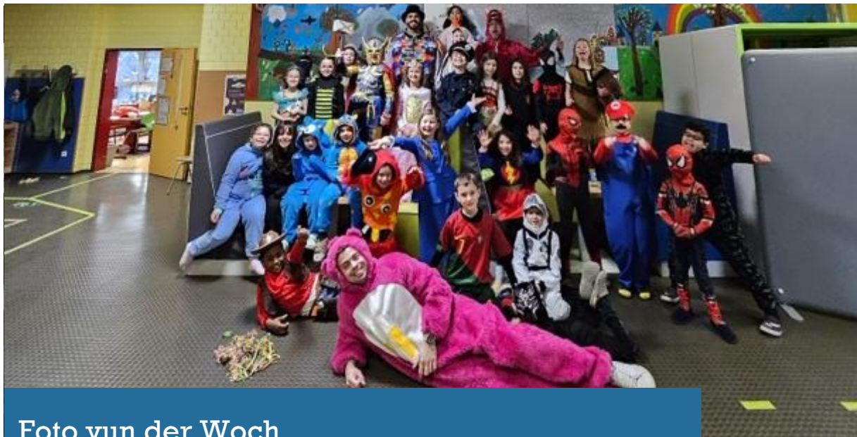
Foto vun der Woch Fuesparty am Cycle 2