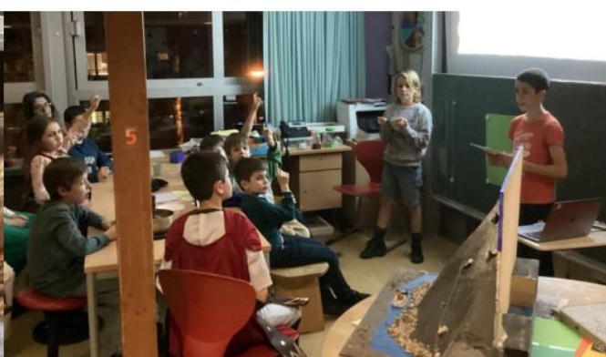
Montagnes présenté par Léonard & Martin - Berge