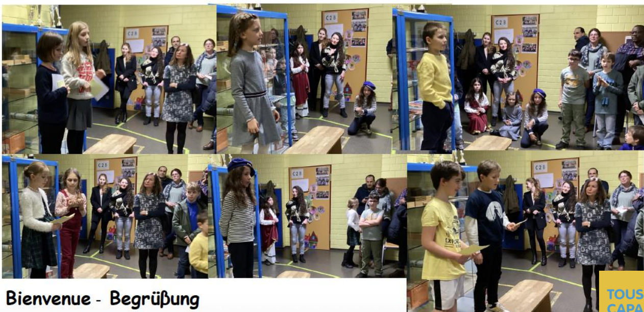
Bienvenue - Begrüßung