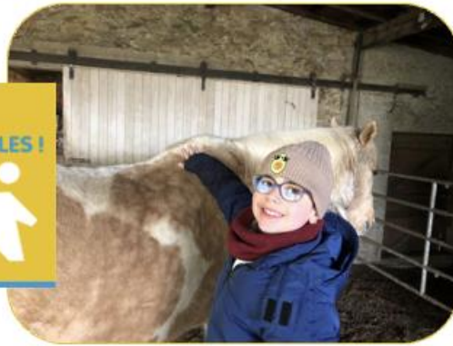
Eng gudd Massage fir d'Caramel.