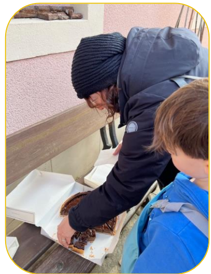
Der Schokoladekuchen war lecker. (Sacha)