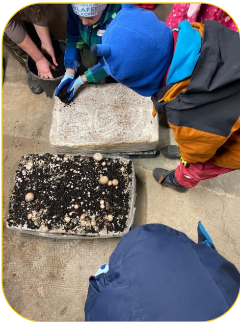
Hier müssen wir das Netz noch aufmachen und Boden drauf streuen. Zum Schluss haben wir auch noch Wasser drauf getan. (Hugo)