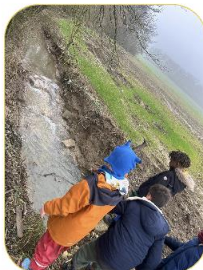
D'Kanner hu vill Spaass am Bulli.