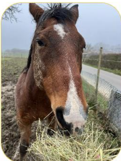
De Bill huet alles am Bléck.