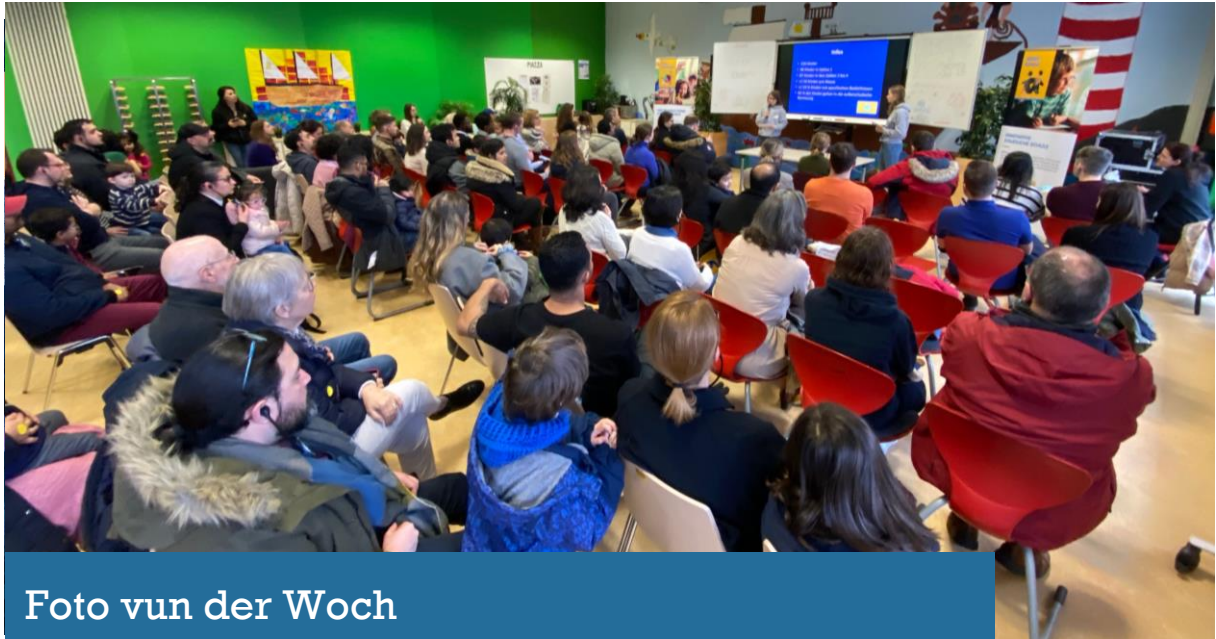
Foto vun der Woch 24.2.2024 – Porte ouverte