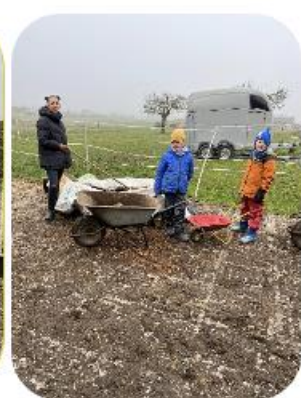
D'Kanner konnten hir Geschécklechkeet beim Schubkarfueren ënner Beweis stellen.