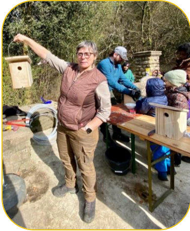
Das ist ein fertiges Häuschen.