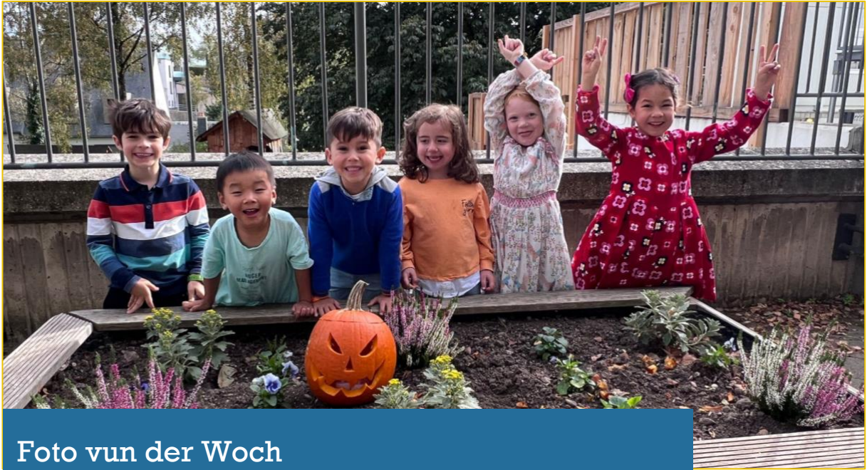
Foto vun der Woch Atelier Gaart am Cycle 1